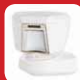
Superieure buitendetector met anti-masking